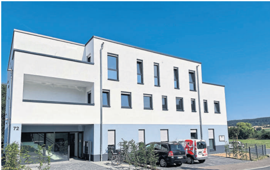
Das neue Wohn- und Geschäftshaus in Buseck am Schützenweg vom Bauträger BPI GmbH verbindet Privat- und Gewerbeflächen unter einem Dach.