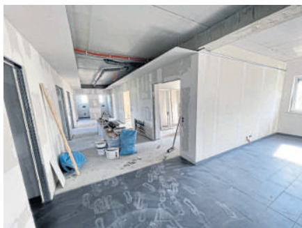
Vom ersten Obergeschoss aus wird ab August die IT-Firma Akquinet Ristec GmbH operieren.

Für den Rohbau des Gebäudes war das heimische Bauunternehmen Becker Beuern verantwortlich. Nur die Fertigstellung der Innenräume der Büroebe für die Akquinet Ristec